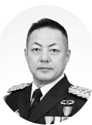
中部方面總監 陸将 遠藤 充